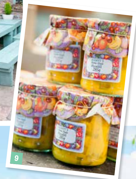
8 Pub The Dalesman in Sedbergh. 9 From farm to table: huisgemaakte piccalilly. 10 Stenen bruggen over riviertjes.