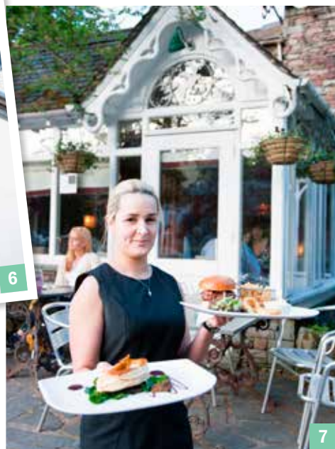
5 Wandelen langs Rydal en Grasmere Lake. 6 Gezellige pubs in Kendal. 7 The Dove Bar & Bistro in Grasmere.